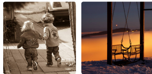
Bild rechts: Schaukel über dem Nebelmeer. Die Weihnachtstage sind besonders – haben einen eigenen Rhythmus, verzaubern alles in ein anderes Licht. Wie dieser Blick über St.Gallen von der Solitüde in Richtung Peter und Paul. Wenn man über dem Nebel ist und auf die Decke blicken kann, so geht es einem schon ganz besonders gut. Oben sein ist schön.

In welcher Form können Schulen und Organisationen deine Ressourcen anzapfen.